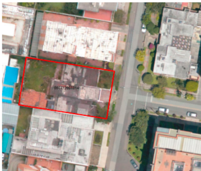
Ilustración 1. Ubicación Geográfica del predio donde se ejecutó el proyecto constructivo Hotel Hilton Garden Inn

Fuente: Pagina Web – Visor Geográfico Ambiental – Secretaría Distrital de Ambiente – SDA, 2020